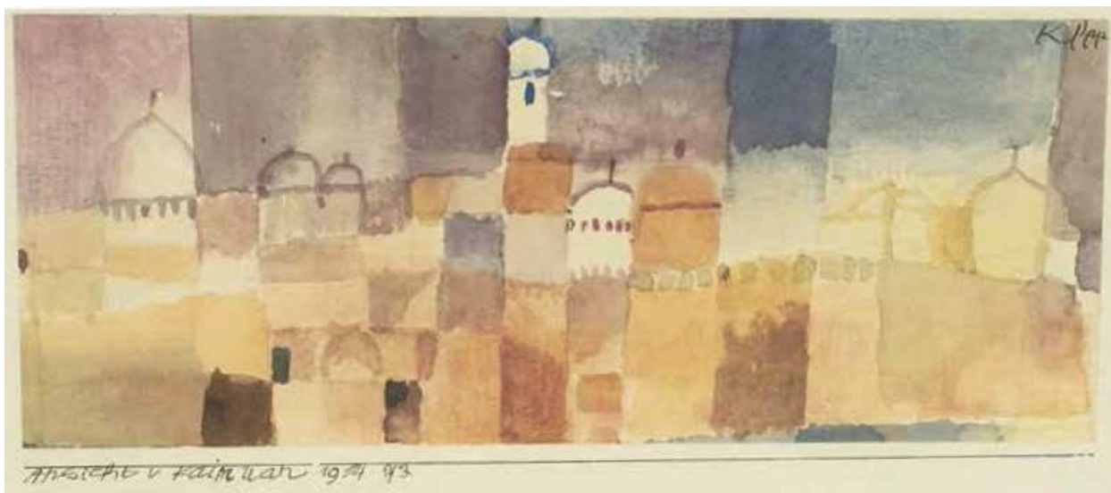
Рис. 1. Пауль Клее. Вид на Кайруан. 1914

Смотрим книгу репродукций Пауля Клее с его биографией, пациент замечает, что с двадцати лет и все следующее десятилетие художнику было плохо. Его картины были тяжелые, мрачные. В тридцать ему стало гораздо лучше, в живописи появилось больше красок и радости. (Проекция своей сегодняшней жизни и преисполненный надежд взгляд в будущее?) Вместе придумываем историю на основе картины «Вид на Кайруан», которую выбрал Б.