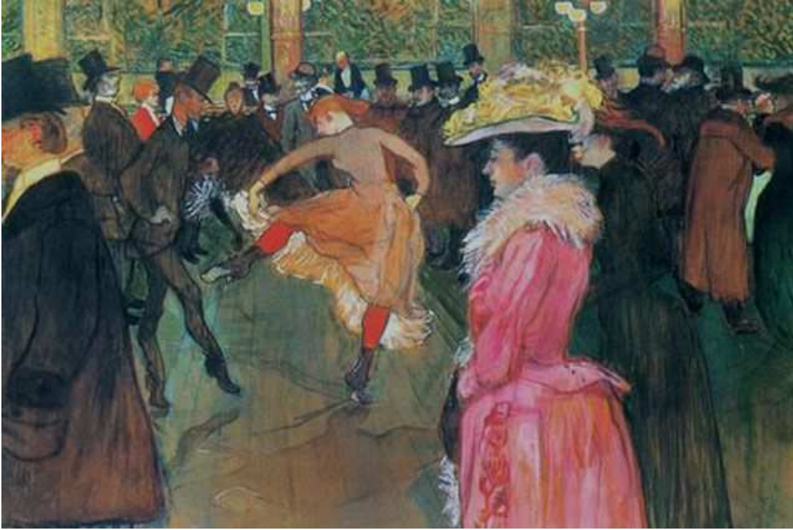
Рис. 2. Анри де Тулуз-Лотрек. Танец в Мулен Руж. 1890

Смотрим книгу репродукций Тулуз-Лотрека с его биографией, Б выбирает картину «Танец в Мулен Руж». Терапевт побуждает его начать, говоря, что с одной историей они уже очень хорошо справились. Б упирается, говорит, что это нужно только мне, потому что я тут главная. Тогда терапевт, догадавшись, что пациенту трудно усвоить, что он сделал что-то хорошо, начинает: